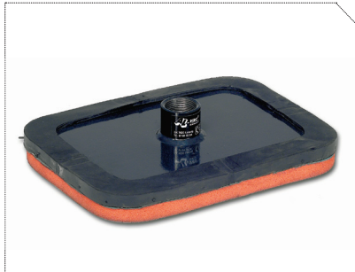
SUGEKOP 200X300 MM, ORANGE GUMMI ELLER SORT GUMMI, WLL 110 KG