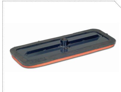
SUGEKOP 200X470 MM, ORANGE GUMMI, WLL 200 KG