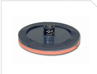
SUGEKOP Ø 300 MM, ORANGE GUMMI ELLER SORT GUMMI, WLL 155 KG