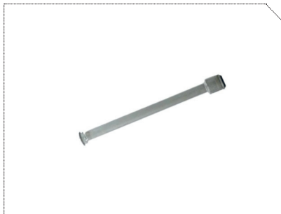
FORLÆNGERLED, 600 MM