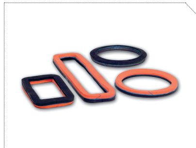
SUGEKOPRINGE, ORT OG ORANGE GUMMI